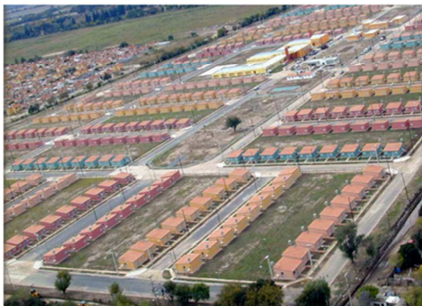
Imagen N° 2. Fotografía aérea de un Barrio Ciudad