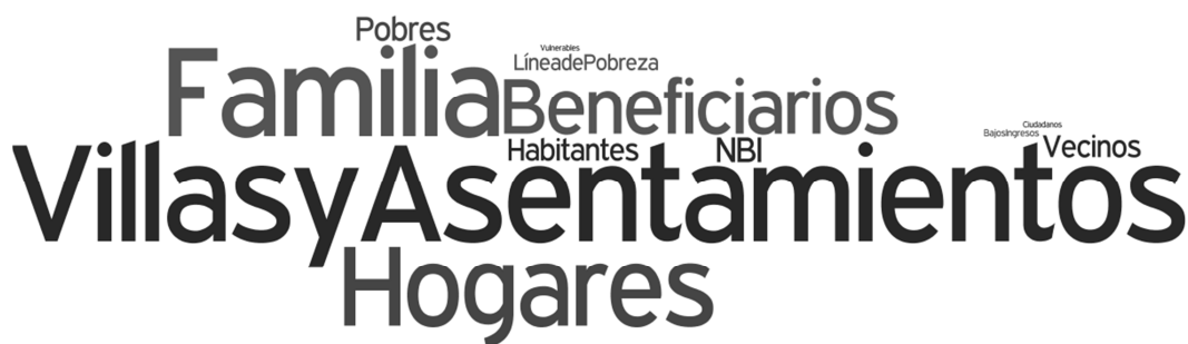
Gráfico N°2. Recurrencias semánticas para población en PROMEBA