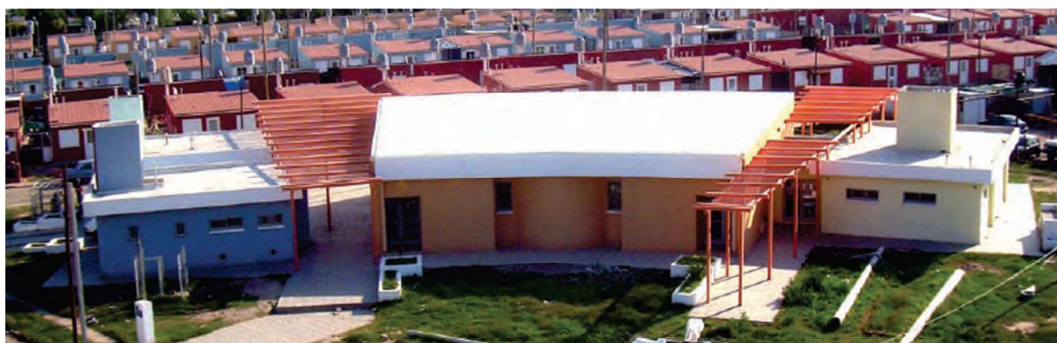
Imagen N°5. Salón de Usos Múltiples, Centro de Salud y nuevas viviendas, Barrio General Savio