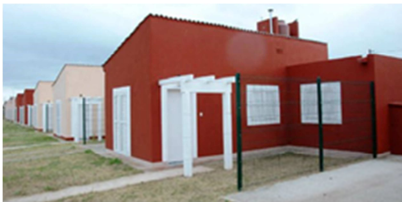
Imagen N°6. Viviendas en Barrio HCM Cabildo

En el año 2015, tiene lugar una nueva operatoria como resultado de una demanda de readaptación del plan llevada adelante por beneficiarios y beneficiarias de la Asociación Civil “Beneficiarios y Adjudicatarios Planes de Viviendas”, quienes se conforman con el objetivo común de “hacer valer los derechos básicos constitucionales como es el acceso a la vivienda digna [y] perseverar en la lucha para alcanzar el objetivo de la vivienda propia” (Blog Hogar Clase Media Mix). De allí surge la “Operatoria Habitacional Especial con aporte Diferencial por Terreno e Infraestructura”, conocido como “Hogar Clase Media Mix” (Boletín Oficial de la Provincia de Córdoba N° 110, 2015). Esta operatoria sólo financia el terreno en tres barrios elegidos por la asociación civil localizados en zonas intermedias de la ciudad 249 , la posibilidad de optar por un crédito subsidiado para la construcción de viviendas a través del Banco de Córdoba para las familias que acrediten la posibilidad de contratar dicho empréstito, y la construcción de barrios con viviendas individuales y no edificios en altura. Las viviendas, además, son diseñadas por sus propietarios.