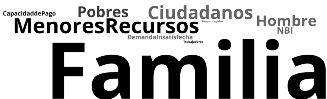
Gráfico N°3. Recurrencias semánticas para población en HCM

Fuente: Elaboración propia con asistencia del programa Wordle