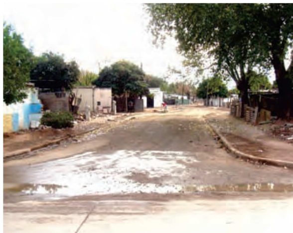
Imagen N°4. Viviendas de Barrio General Savio luego de la intervención