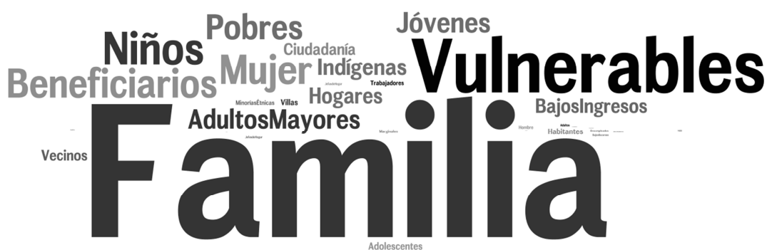
Gráfico N°1. Recurrencias semánticas de población en PMCMV