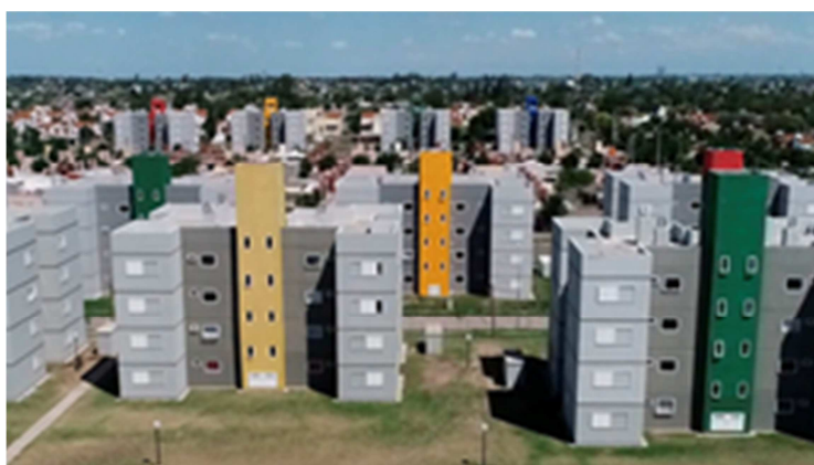
Imagen N°7. Torres de Barrio HCM Los Álamos