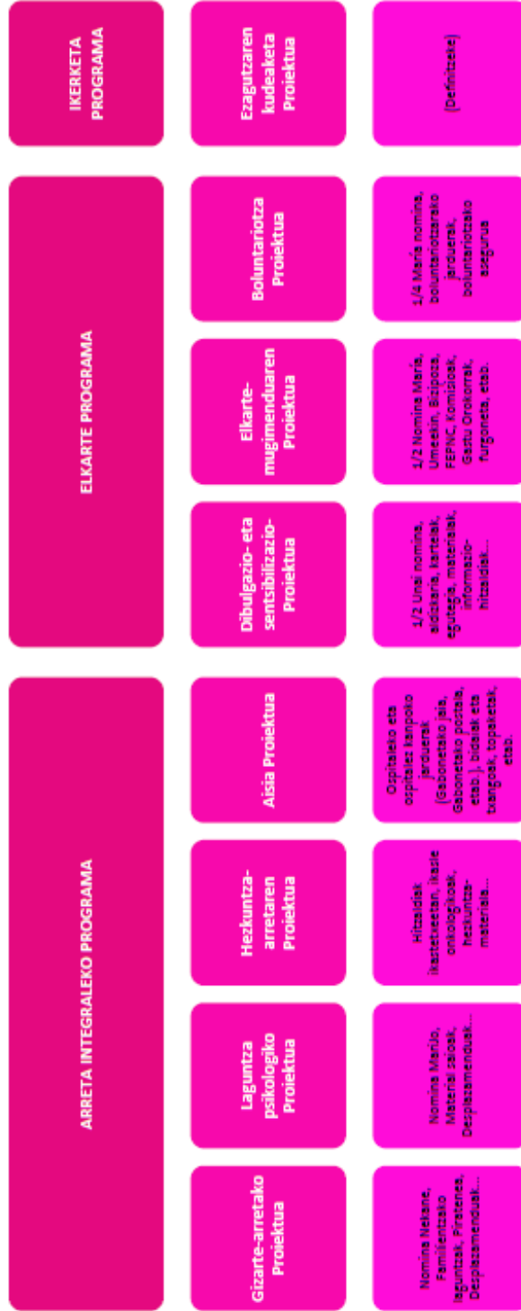
4.1 irudia: ASPANOGIren jardueren eskema.