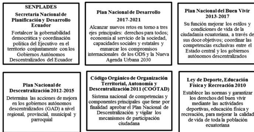
Figura 1. Herramientas de Innovación en las políticas de ocio en Ecuador.

De esta forma el gobierno ecuatoriano, busca transformar la gestión pública, a través del buen vivir o Sumak Kawsay de su población (Porras, 2013) para lograr la armonía dentro de la convivencia ciudadana. De esta forma toman protagonismo las políticas de descentralización (Jaramillo, 1964) ya que son grandes herramientas de cambio, que respaldan un desarrollo local efectivo, adaptándose a las realidades de cada localidad. En el Ecuador dichas acciones han logrado promover los principios de las tres E (eficacia, eficiencias y equidad), en territorios urbanos y rurales. A continuación, se describen las principales herramientas de innovación política: