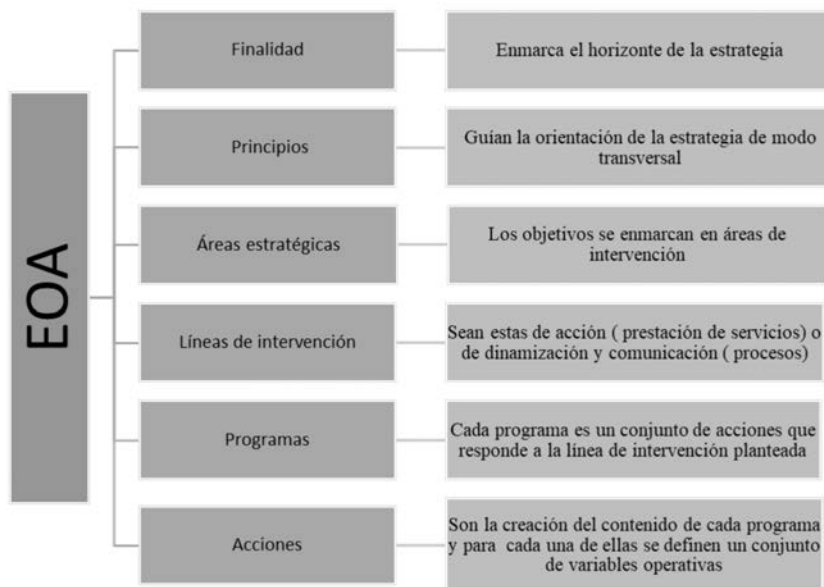
Figura 4. Elementos y estructura de la estrategia.