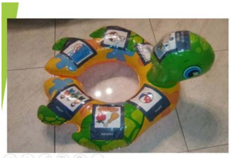
Figura 3. Un flotador adaptado