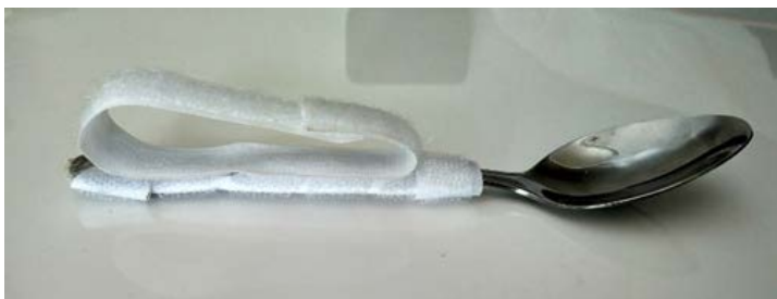
Figura 2. Una cuchara adaptada