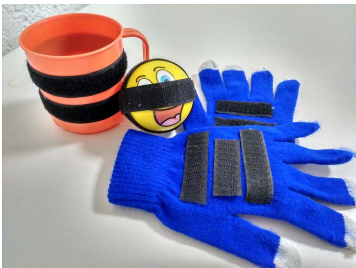
Figura 4. Guantes con velcro