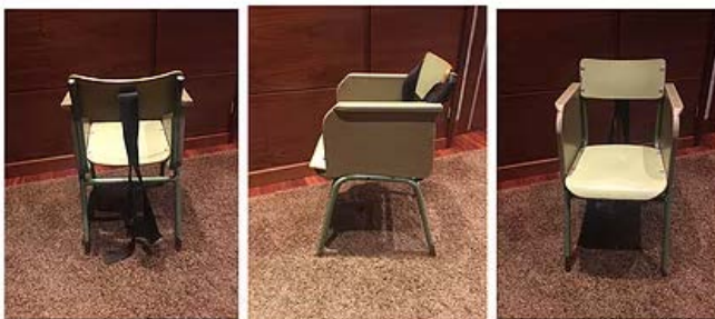
Figura 1. Silla adaptada para un niño con espina Bífida http://andreadarpon.wixsite.com/loslimiteslosponestu/copia-de-accesibility-scan